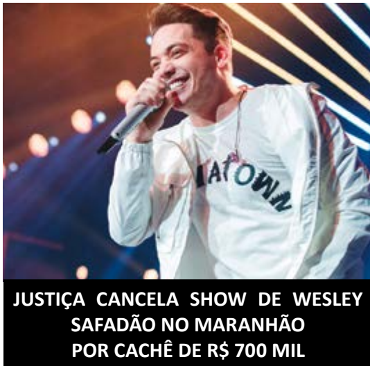
JUSTIÇA CANCELA SHOW DE WESLEY SAFADÃO NO MARANHÃO POR CACHÊ DE R$ 700 MIL

- Continua na Barretos Mix Clean Lavanderia a mega promoção na lavagem de qualquer tamanho de edredons por apenas R$34,90. Mas para pagamento adiantado no cartão de crédito, débito, pix ou dinheiro. Promoção válida até 31 de outubro. Aproveite. Barretos Mix Clean Lavanderia fica na 18 entre 1 e 01 WhatsApp (17) 99167:9736.