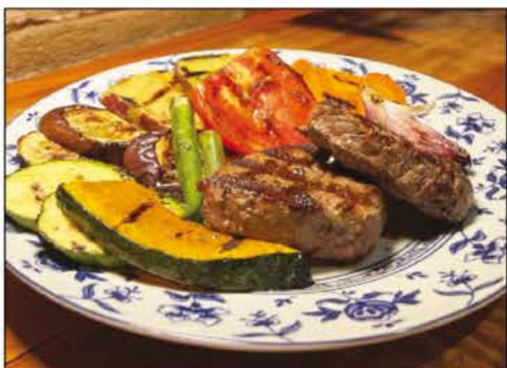
Tem como almoçar ou jantar no Seo Lucio sem sair da dieta! Conheça os Feitos na Brasa e escolha os acompanhamentos que mais te agradam. O Seo Lucio fica na Rua 26 (31x33).