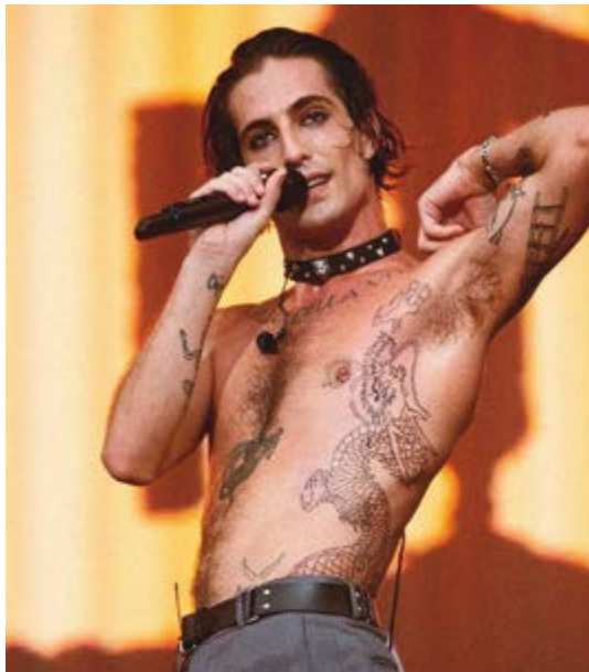
CANTOR DO MÃNESKIN SERIA NOVO AFFAIR DE ANITTA