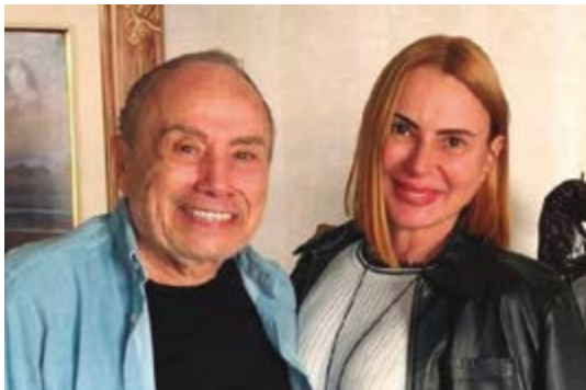
MULHER DE STÊNIO GARCIA AFIRMOU VIVER CASAMENTO DE FACHADA EM ÁUDIOS VAZADOS

- Uma opção leve e nutritiva para o seu dia, é a Taça de Frutas com iogurte da La Maison : Banana, mamão, morango, iogurte natural e granola... Uma delícia! Peça na La Maison mais próxima de você. Tem La Maison na 23 esquina 16, na 22 esquina 15, na 18 esquina 1 e na avenida João Baroni, 998.