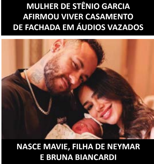
NASCE MAVIE, FILHA DE NEYMAR E BRUNA BIANCARDI

- O apresentador Fausto Silva , falou pela primeira vez sobre o transplante de coração e os boatos de que furou fila para receber o novo órgão, no último domingo (8), ao programa "Domingo Espetacular", da Record TV. Faustão relatou que depois de chegar de uma viagem feita com a família em Miami, realizou uma bateria de exames. Após saírem os resultados, ele soube através dos médicos que precisaria operar. "Eu já sabia que um dia teria que fazer uma cirurgia de coração. Não sabia que era transplante. Tem uma época em que você fica naquela expectativa: o que dá para fazer? Na verdade, é uma questão de genética. Você vê, um cara que nunca fumou, nunca usou droga, usou nada, acabou caindo na malha fina", falou.