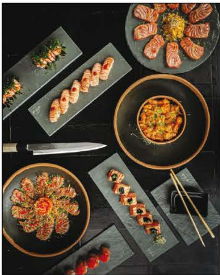
Viva uma experiência Saikoo e aproveite a sua terça em grande estilo, com muitas especialidades, bons drinks e um ambiente agradável! Na Rua 26 esq. Av. 39 - 3324-1565