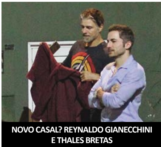
NOVO CASAL? REYNALDO GIANECCHINI E THALES BRETAS

- Reynaldo Gianecchini e Thales Bretas foram fotografados jantando juntos na Gávea, na Zona Sul do Rio de Janeiro. O médico dermatologista foi assistir ao espetáculo "A herança", em cartaz em um shopping localizado no mesmo bairro e que tem Giane no elenco. Depois da sessão da peça, eles seguiram para o restaurante. Após o jantar a dois, Gianecchini e Bretas foram embora juntos no carro dirigido pelo viúvo do humorista Paulo Gustavo . O médico, inclusive, fez questão de abrir a porta do veículo para o ator entrar, na maior gentileza.