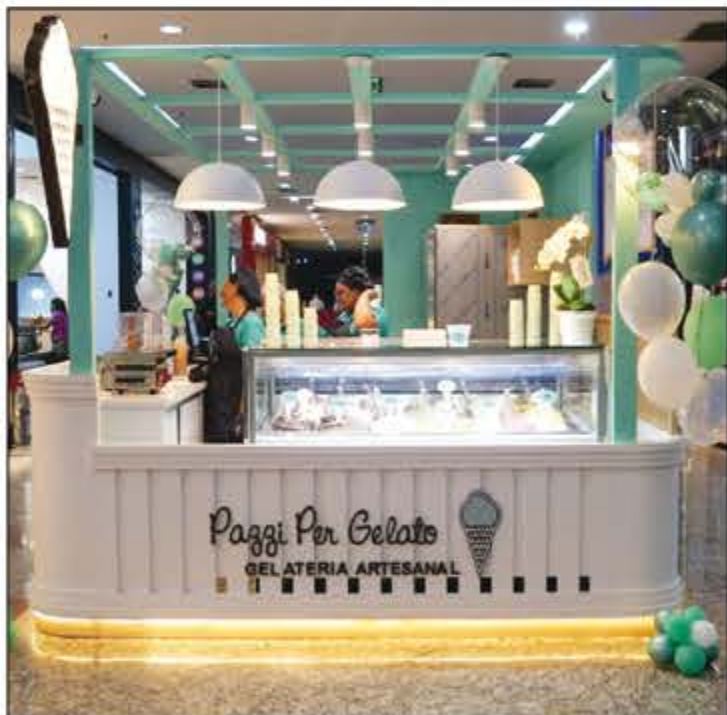
A Pazzi Per Gelato chegou em Barretos num quiosque todo charmoso, trazendo delícias e sobremesas irresistíveis! Com sabores novos a toda semana, motivos para se refrescar não vão faltar! Dê uma passadinha no North Shopping e aproveite todas as delícias! O quiosque da Pazzi fica na frente das lojas Marisa!