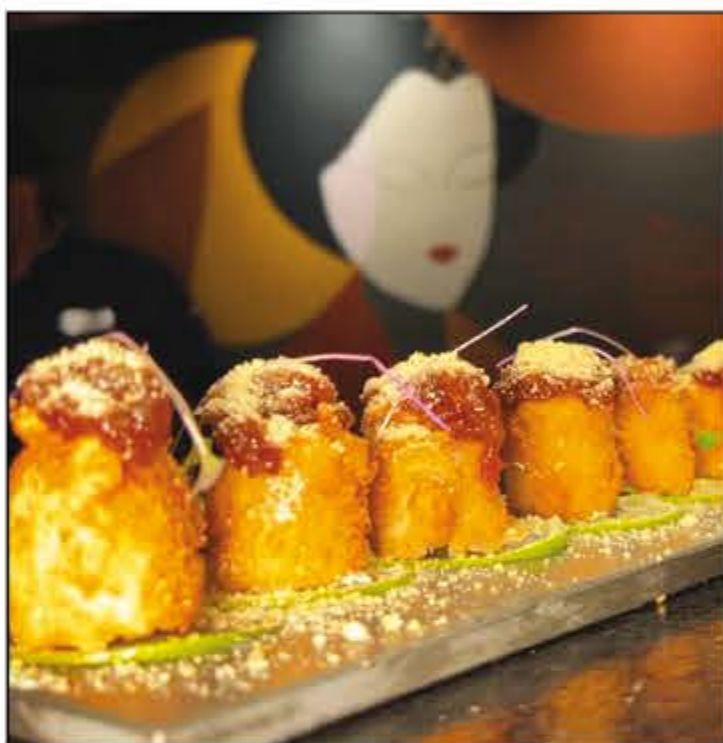
Fried cheese & fig: joys de robalo recheados com cream cheese, chutney de figo e finalizados com castanhas... Uma especialidade Saikoo quente e agridoce para você viver novas experiências! Experimente na Rua 26 esq. Av. 39 - 3324-1565