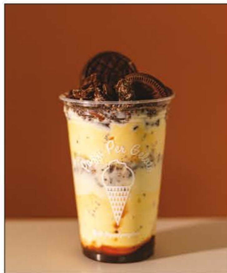
Dica saborosa para a sua terça Que tal experimentar a Taça Pazzi de Negresco? Terça é o dia perfeito para saborear uma boa sobremesa. E a Pazzi oferece, quatro sabores incríveis de taça: Cookies, Morango, Negresco e Banoffee. Aproveite a dica, escolha o seu sabor favorito e corra para a Pazzi para se deliciar! No North Shopping Barretos