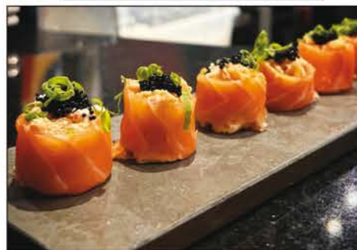
Ebi black para aproveitar a sua quarta no lounge da Saikoo... Este sushi é um joy de salmão sem arroz recheado com camarão e coberto por ovas negras e cebolinha, já experimentou? Saikoo fica na Rua 26 esq. Av. 39 - 3324-1565