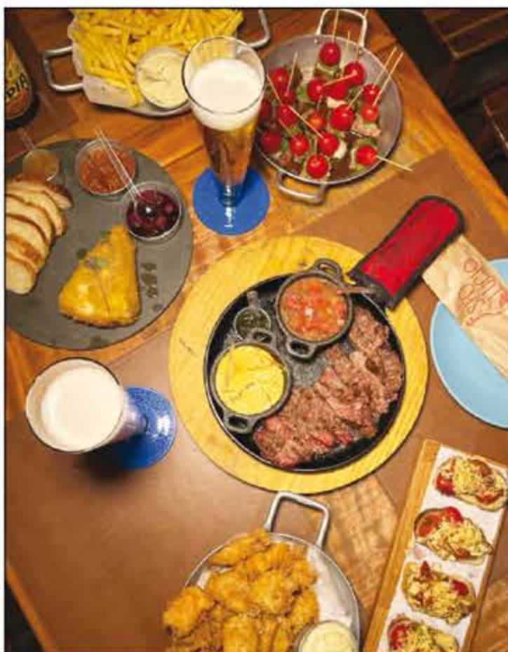
Quarta-feira chegou e com ela o Empório Seo Lucio está de portas abertas esperando por você! Aproveite para almoçar e jantar no Seo Lucio! O Seo Lucio fica na Rua 26 (31x33).