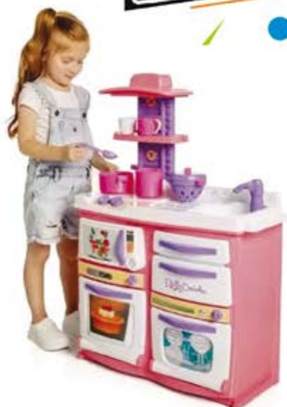
COZINHA INFANTIL TATETI - CALESITA