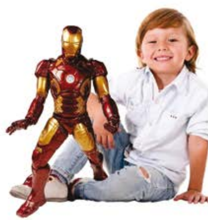
BONECO HOMEM DE FERRO