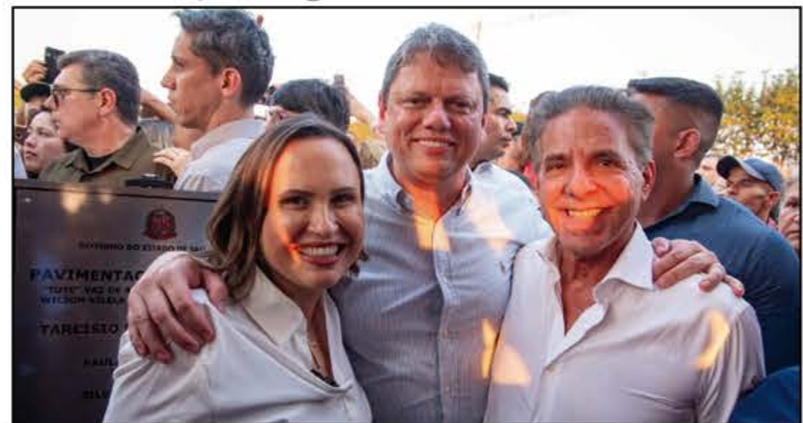
Governador ao lado da prefeita Paula Lemos e do prefeito de Jaborandi, Silvío Vaz de Almeida, na inauguração da vicinal em agosto

A Paraná Pesquisas divulgou nesta quinta-feira (5) uma pesquisa mostrando que 72,8% dos barretenses aprovam a administração do governador de São Paulo, Tarcísio de Freitas. Os que desaprovam são 22% e 5,2% não souberam responder ou não opinaram.