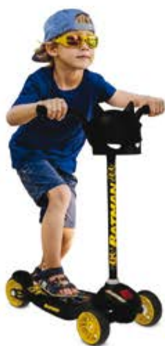
PATINETE SKATENET BATMAN