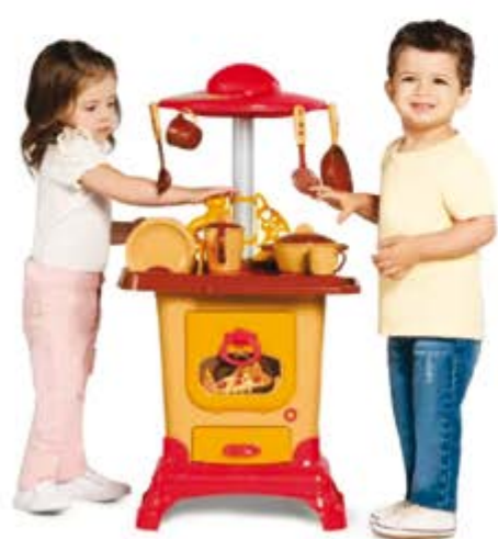
COZINHA DO SITIO COMPLETA TATETI