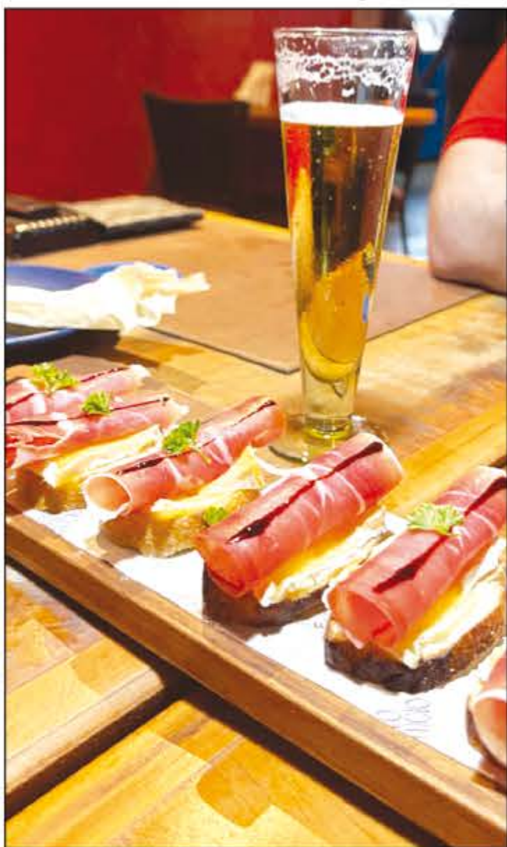
Dia de apreciar um Chopp Antarctica estupidamente gelado no Empório Seo Lucio. Além de um cardápio completo e espaço Kids com monitor para a criançada! Chame a família e amigos para uma noite divertida e especial! O Seo Lucio fica na Rua 26 (31x33).