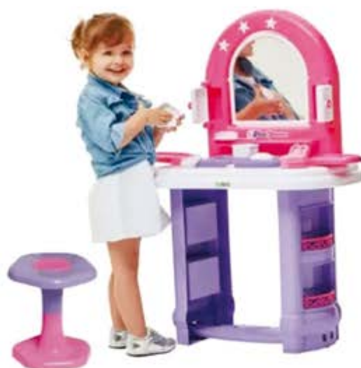
PENTEADEIRA MISS GLAMOUR - TATETI