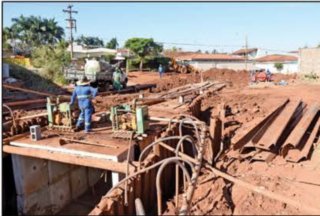
Atuando em espaços abertos, trabalhadores são os que mais sentem os efeitos negativos

Barretos registrou nesta quinta-feira (21), 37,8 graus, ocupando a terceira posição entre as cidades mais quentes do Estado de São Paulo. Aparecida d'Oeste, na região de São José do Rio Preto, marcou 40 graus, sendo a mais quente do estado. Igarapava registrou 39,9 graus, ficando na segunda posição.