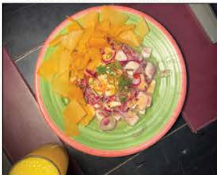
Machu Picchu para iniciar o final de semana na Saikoo Sushi Lounge