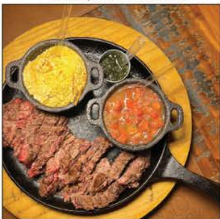
Uma ótima pedida para hoje são os Feitos na Brasa do Empório Seo Lucio. No Empório você encontra pratos, beliscos, pedra de frios e saladas que vão agradar seus amigos e família! O Seo Lucio fica na Rua 26 (31x33).