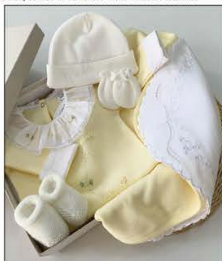
Aaah as Saídas de Maternidade! Na Ana's Ateliê você encontra os modelos de malha tricotada que estão conquistando as mães! Um modelinho fofo, confortável e 100% algodão! Vem conferir as opções disponíveis! Compre online pelo site www.anasateliê.com.br | Busque por "malha tricotil" Atendimento pelo WhatsApp (17) 99106-7231 Loja Física: Rua 14, esquina av. 21, 481 | Barretos-SP