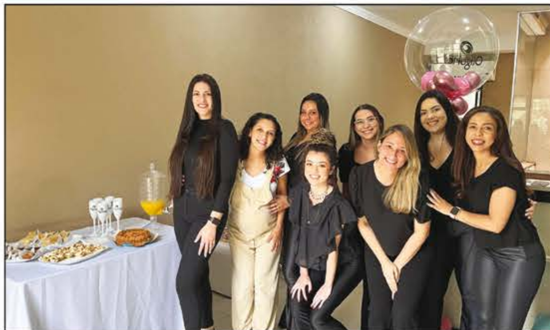
A OligoFlora Barretos completou 6 anos de história fazendo jus à marca do sucesso e o bem estar de cada cliente! Motivos para toda a equipe comemorar é o que não faltam! Pode aplaudir!