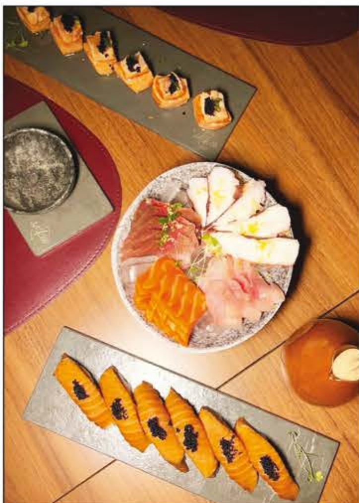
Aproveite hoje para viver novas experiências Saikoo aqui no lounge, ou peça delivery e aproveite as especialidades na sua casa! A Saikoo fica na Rua 26 esq. Av. 39 - 3324-1565