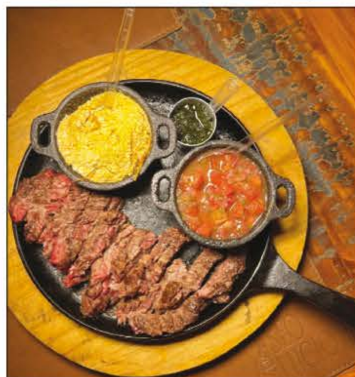
Sábado chegou e com ele a dica da Coluna é almoçar ou jantar no Empório Seo Lucio! Uma ótima pedida são os Feitos na Brasa, mas no empório você encontra muitos pratos, beliscos, pedra de frios e saladas que vão agradar seus amigos e família! O Seo Lucio fica na Rua 26 (31x33)