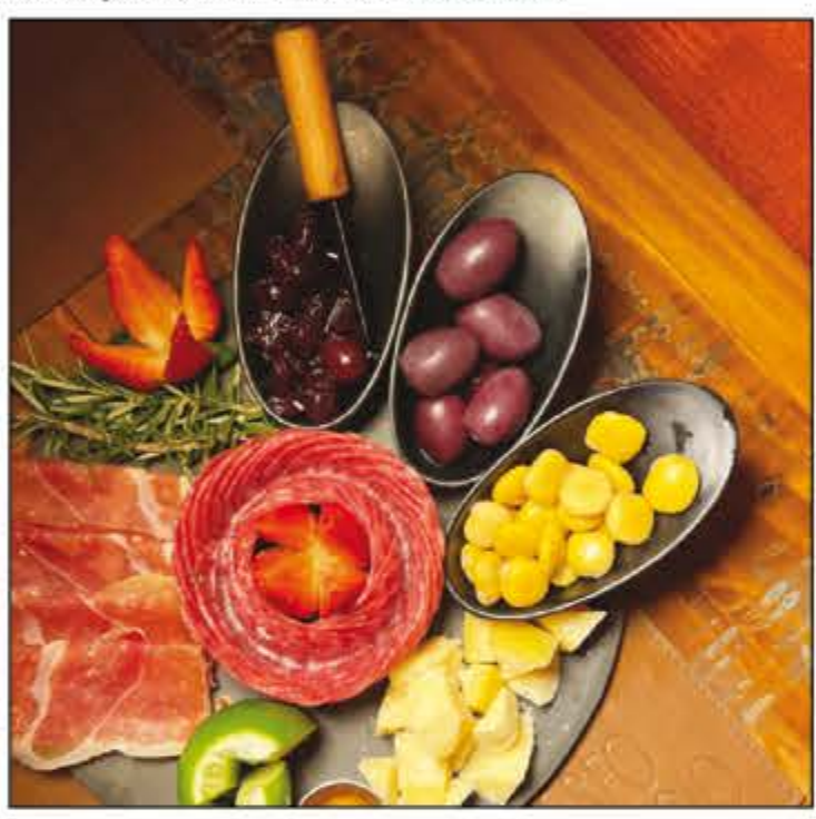
Neste calor, nada melhor do que uma pedra de frios... No Empório Selo Lucio você pode escolher as prontas que estão no cardápio, mas pode montar como preferir também! Chame a galera e para curtir o final de semana que está apenas começando! .O Seo Lucio fica na Rua 26 (31x33).