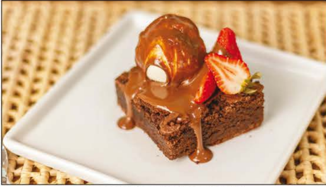
Doces Gelatos para adoçar a sua sexta! Sugestão da PAZZI PER GELATO | North Shopping Brownie de chocolate belga com uma bola de gelato. Ele é tão maravilhoso, é impossível ficar só olhando!