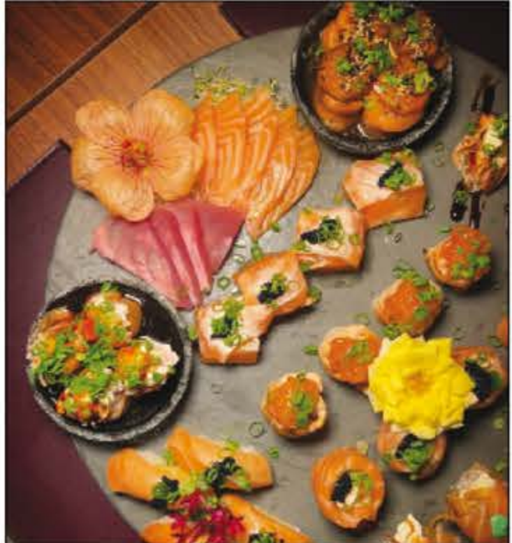
Combinado Saikoo para você compartilhar com a família e os amigos... Na Saikoo você encontra opções entre 20 e 80 peças! Experimente na Rua 26 eq. Av. 39 - 3324-1565