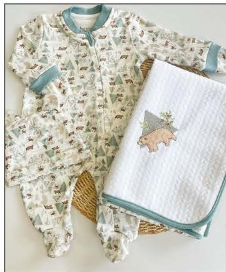
Coleção "Urso na Floresta" chegou para deixar as mães de menino ainda mais apaixonadas!

A marca "Hug" é uma nova aposta da Ana's Ateliê, temos certeza que vai ser a mais nova queridinha de vocês! Modelos com qualidade, custo benefício e muita variedade! Vem conferir Loja física: Rua 14, esquina av. 21, 481, Centro, Barretos/SP