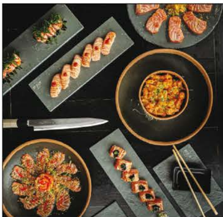
Viva uma experiência Saikoo e aproveite a sua sexta em grande estilo, com muitas especialidades, bons drinks e um ambiente agradável! Na Rua 26 esq. Av. 39 - 3324-1565