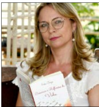
"Alegria, quanto custa? Onde encontrar?" Perguntas feitas em 2020,

no auge da pandemia, e que moram no meu livro Crônicas e Reflexões da Vida.