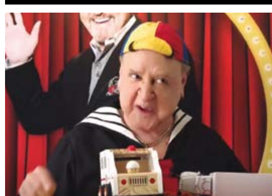
QUICO DE 'CHAVES' FAZ COMERCIAL CONTRA IMIGRAÇÃO ILEGAL NOS EUA E CAUSA POLÊMICA