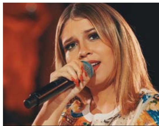
PILOTOS FORAM RESPONSÁVEIS PELA QUEDA DE AVIÃO COM MARÍLIA, CONCLUI POLÍCIA