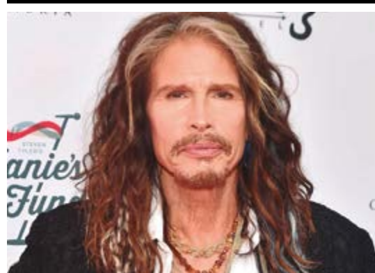
AEROSMITH CANCELA TODOS OS SHOWS APÓS GRAVE LESÃO VOCAL DE STEVEN TYLER