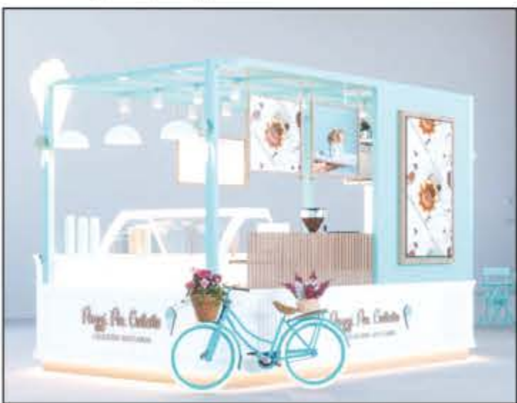
Acontece hoje a inauguração do quiosque mais doce que está chegando no North Shopping! Pazzi Per Gelato é sinônimo de sucesso! Para quem é fã de gelato e sobremesas hoje é dia de prestigiar a inauguração que acontece a partir do meio dia. Sempre vai ter uma opção para você ficar com gostinho de quero mais! Saboreie e depois me conte!