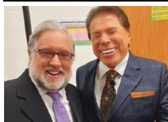
LEÃO LOBO: PROBLEMAS DE MEMÓRIA AFASTARAM SILVIO SANTOS DO ESTÚDIOS DE TV