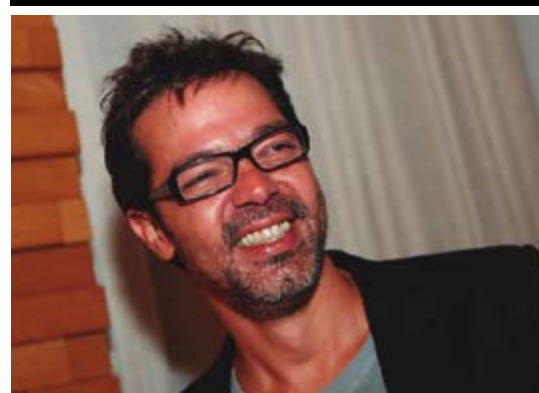
BRUNO MAZZEO ANUNCIA SAÍDA DA TV GLOBO: "NOVOS DESAFIOS"