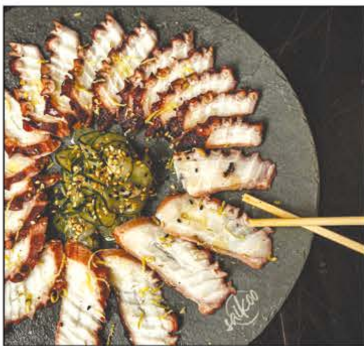
Sugestão da Saikoo Sushi Lounge: Lâminas de polvo temperadas... Sashimi com este fruto do mar saboroso e ótimo para a saúde! Esta proteína possui baixo teor calórico e pouca gordura, além de ser fonte de ferro, cálcio e outras vitaminas. Experimente na Rua 26 esq. Av. 39 - 3324-1565