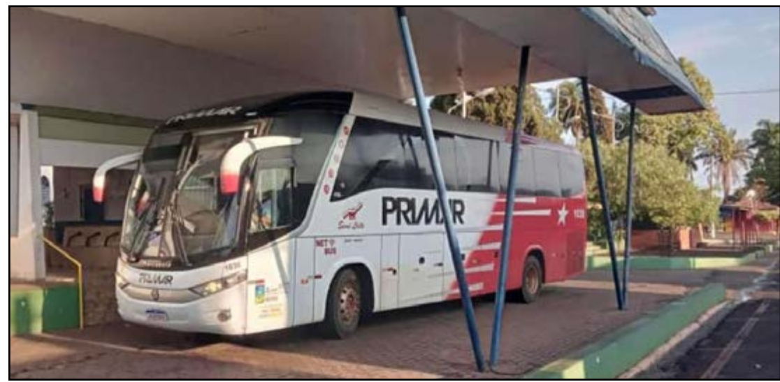
Ônibus da Primar durante parada na rodoviária de Colômbia

A linha de ônibus entre a cidade mineira e Barretos foi restabelecida na segunda-feira (2), após um ano de interrupção, com a desistência da Viação Rio Grande. A nova é a empresa Primar.