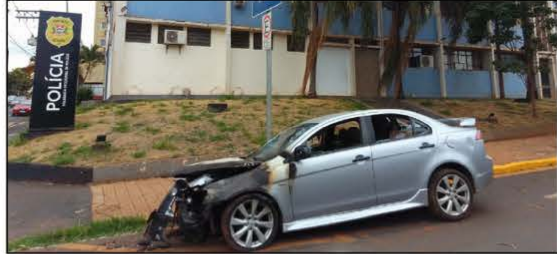
Veículo pegou fogo depois de 'decolar' ao se chocar contra barranco

Acionado apoio, este também acabou sendo interceptado, confessando ser realmente comparsa do primeiro indivíduo. Os dois foram presos em flagrante.